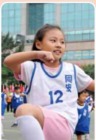
善用科技 Technology Utilization