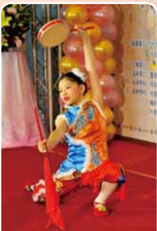
自主學習 Voluntarily Learning