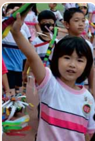
審美創新 Aesthetics and innovation