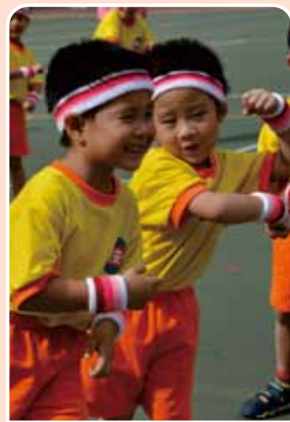
互助關懷 Mutual Assistance and Cares